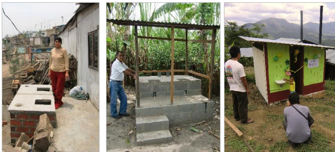
Fotos 4/5/6: Módulo Sanitário de banheiro seco consiste de i) duas caixas secas (encima da terra) construídas de tijolos o blocos de cimento ou outro material que seja disponível na região com as instalações e equipamentos, ii) o piso do banheiro e, caso necessário, iii) uma escada