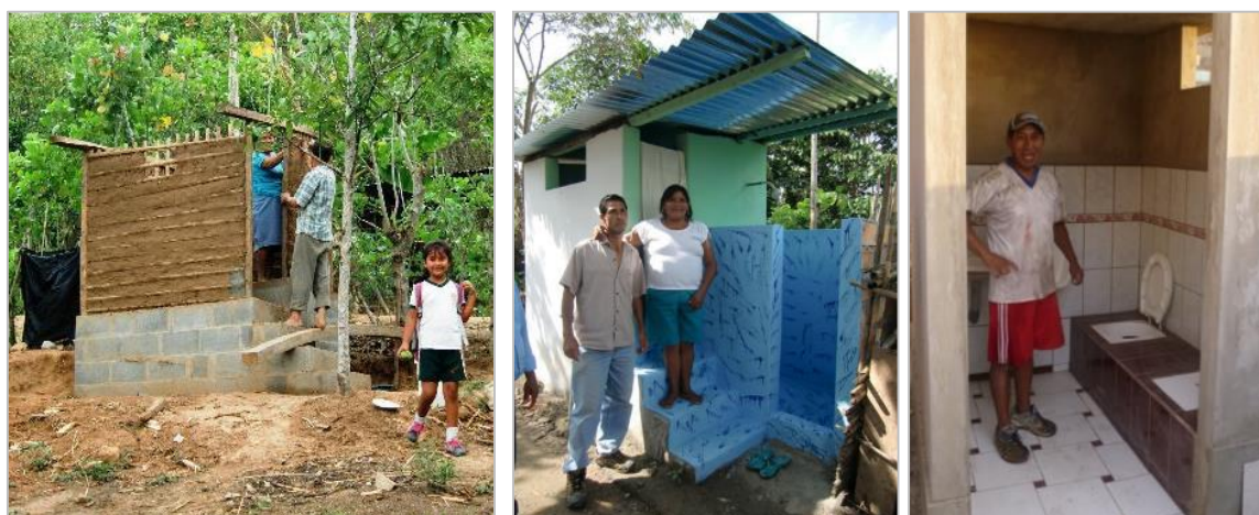
Fotos 7/8/9: Projeto participativo de instalação em projetos sócias em Peru, o módulo sanitário construído com mão de obra qualificada e os paredes, teto e acabamento (inc. chuveiro) fica na responsabilidade de usuários para garantir sua identificação com a solução sanitária