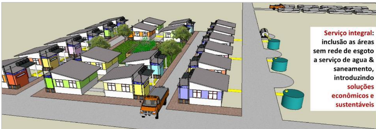
Esquema 5: Exemplo para um modelo de gestão de saneamento seco para uma urbanização com serviço completo de tratamento (coleta de urina e coleta de material fecal com compostagem central)

Em outras situações pode ser necessário prestar um serviço de coleta de material fecal e seu o pos-tratamento , garantindo maior controle público sobre a destinação final (Esquema 4). Finalmente, algumas situações (por exemplo áreas inundadas ou alto nível freáticos) podem exigir incluir adicionalmente a coleta de urinas e tratamento de aguas cinzas (esquema 5). Atualmente no Peru algumas empresas municipais de saneamento introduzem os modelos da Rotaria para oferecer um serviço integral, atendendo as áreas com e sem rede de esgoto com serviço organizada e controlada de saneamento .