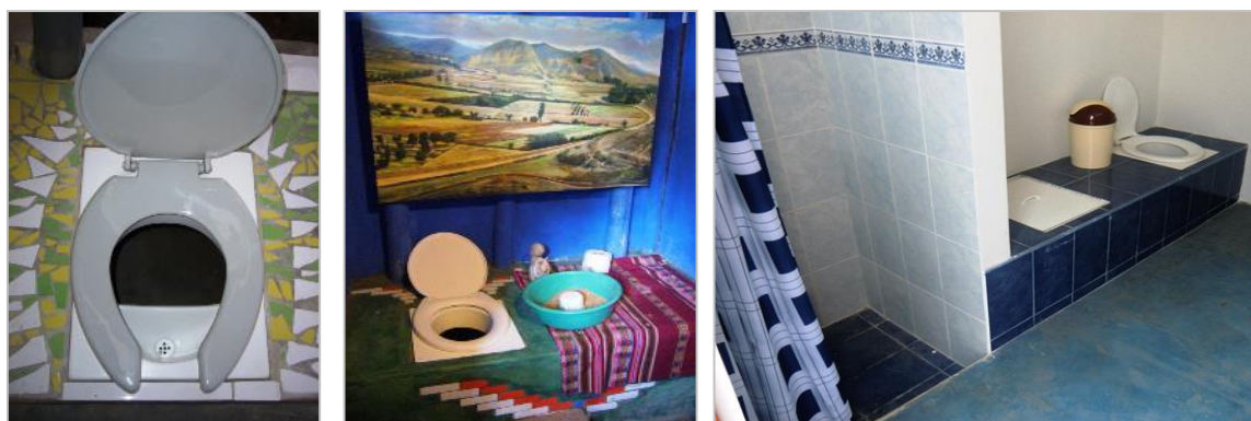
Fotos 10/11/12: Exemplos para acabamento de Eco Sanitário de projetos participativos no Peru