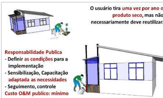
Esquema 3: Modelo de gestão individual, aplicável no âmbito rural