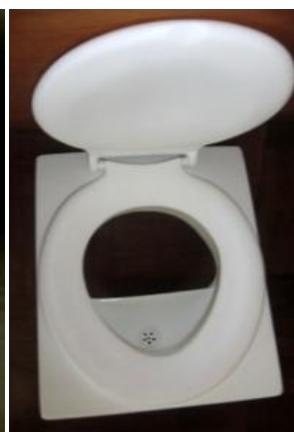
Foto 2. Eco sanitário montado com assento sanitário normal