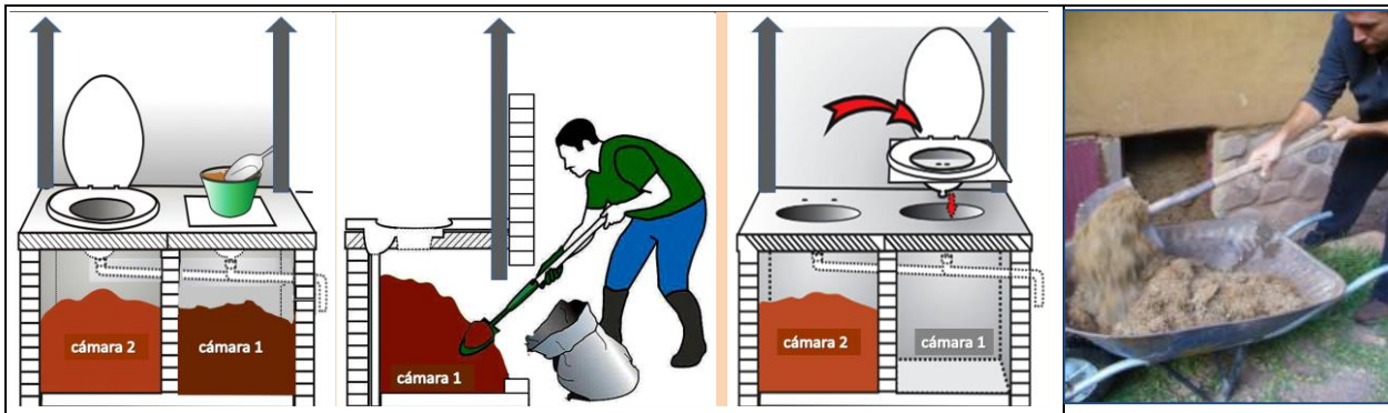
Esquema 1: Esquema de utilização de banheiro seco com duas caixas e foto de produto na hora de tirar

Funcionamento de sistema de duas caixas secas: Garante que o processo de secagem termina dentro de sistema, evitando assim qualquer contato com material fecal não estabilizado. A esquema 1 mostra a operação: somente um caixa está em utilização (equipado com eco-sanitário) e quando esta fica cheio (depois de 8 a 15 meses de uso) o eco-sanitário deve ser cambiado a outra caixa, deixando durante seu uso o material na primeira caixa somente secar. Neste tempo o volume de material fecal vai diminuir por 40 a 60%. Quando a segunda caixa também fica cheia deve ser tirado o material fecal da primeira caixa, que sai totalmente seco, sem odor, sem atividade microbiana e depois o eco-sanitário volta a essa caixa.