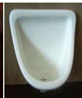
Foto 3: Mictório seco para os homens, seu uso é opcional (material: Fibra de vidro)