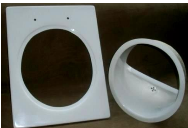
Foto 1: Partes de Eco Sanitário da Rotária; portador e sanitário com segregador da urina (fácil para tirar e lavar); Material: fibra de vidro

Experiências com a aplicação e uso dos banheiros ecologicos secos ja tem na escala internacional, por exemplo são aplicados como sistema domiciliares em grande escala em regiões ruais e urbanas de Bolívia, México e África do Sul. A empresa ROTÁRIA tem experiências nesta área especialmente através de sua filial, a empresa Rotária del Peru que desenvolveu seu próprio equipamento e até agora aplicou cerca de 1.000 banheiros ecológicos secos em diversas comunidades Peruanas (Fotos 4 a 12).