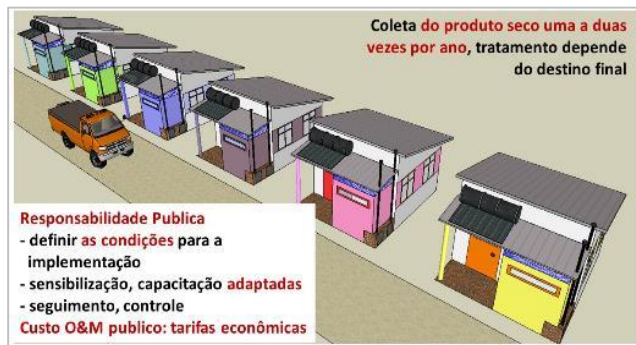
Esquema 4: Modelo de gestão comunitário, coleta (cada 6 a 12 meses) e pos-tratamento de material fecal